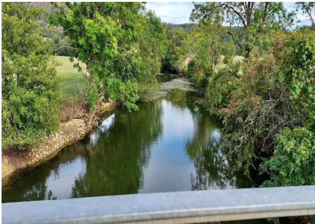
Photo amont de la chaussée depuis le pont, la rivière en eau sur des centaines de mètres