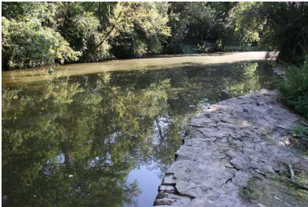
Photo aval de la chaussée : un mince filet d'eau la rivière en grande partie à sec

Photo amont de la chaussée, la rivière en eau et profonde sur des centaines de mètres